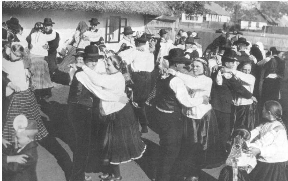
Tánc a lakodalomban

Házi feladat: Kérlek gyűjts a könyvtárban vagy az internet segítségével 3 db vőfélyverset, majd írd le a füzetedbe!