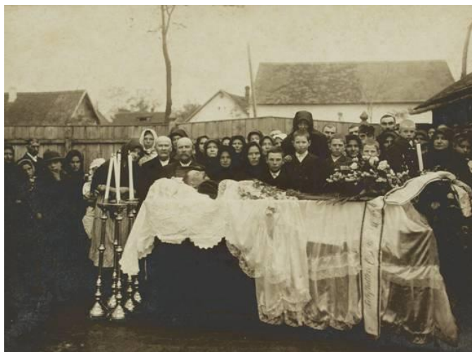
Búcsúztatás az udvaron