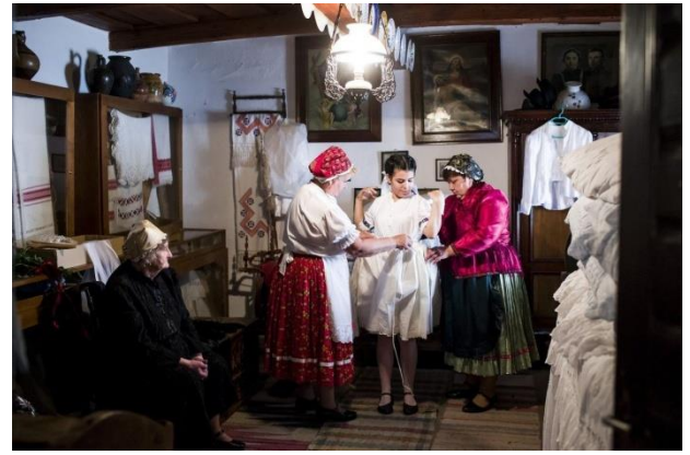
Öltöztetik a menyasszonyt