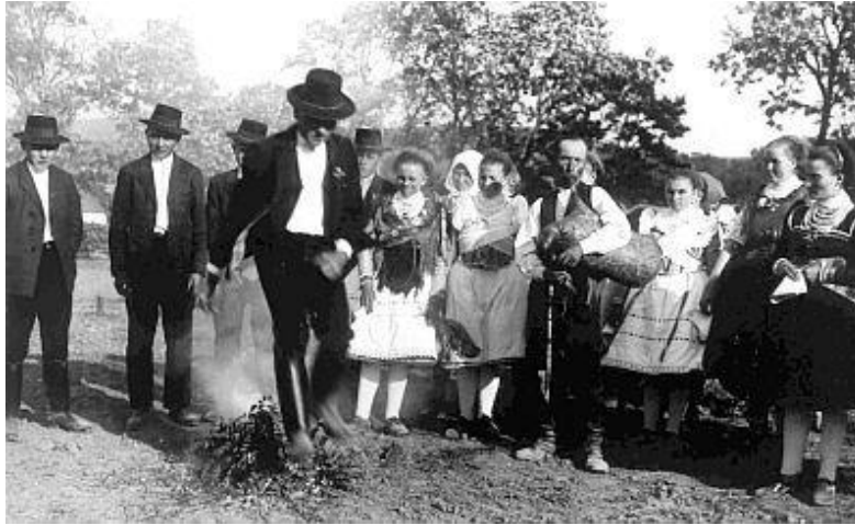
Szent Iván napi tűzgrás