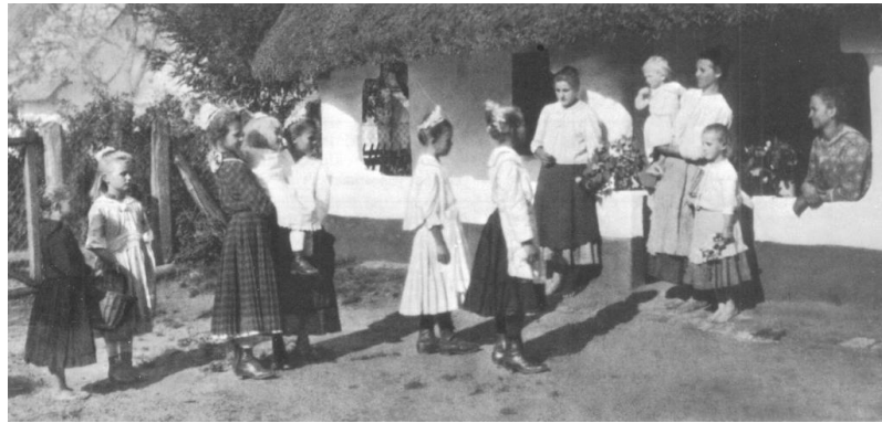
Pünkösdi királyné járás

Házi feladat: Fiúk: Kérlek, legyél most költő és írd meg nekem egy négy soros locsolóverset! Lányok: Kérlek, tervezd meg nekem egy szép tojásmintát!