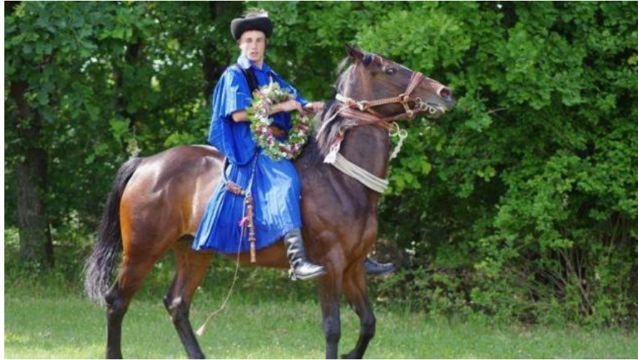
A megválasztott pünkösdi király