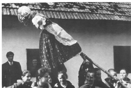
Viszik a kiszehábot

Virágvasárnap tartják a palócok a kiszehajtást. Egy szalmabábut menyecskeruhába öltöztetnek a tél jelképeként fiatal lányok, végigviszik dalolva a falun, majd a vízbe dobják vagy elégetik. Ez a szokás a téltemetés az ébredő természet ősi ünnepét, a húsvétot vezeti be. Figyelnél kellett, hogy út közben vissza nem fordítsák a bábut, mert akkor visszajön a hideg, a betegség vagy a jégeső a faluba.