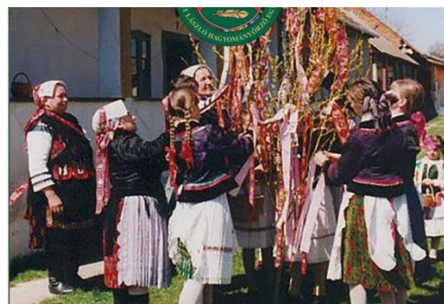
Díszítik a villót

A villőzés szokásához zöld ágakat gyűjtöttek a lányok, összekötötték, színes szalagokat tettek rá és kifűjt, díszes tojásokkal díszítették. 8-10 lány vitt egy villóágot, ami a tavasz közeledtét jelképezte. Házról házra jártak és jókívánásokat énekeltek. A gazdasszony letört egy kis darabot az ágból, és megveregette vele a lányokat, miközben ezt mondta nekik: „Mind menjetek férjhez!”