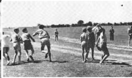
Mancsozás és mancsozó bot, golyóval